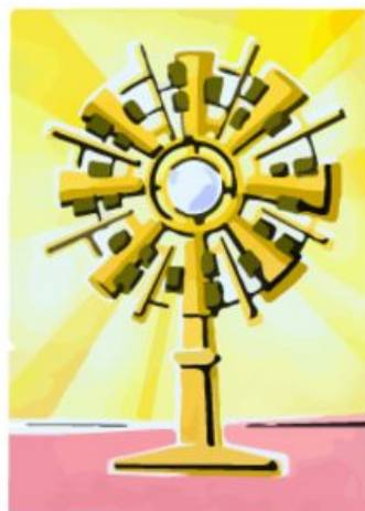
Abbildung 5: