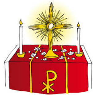
Abbildung 2: aus: pfarrbriefservice.de

An Fronleichnam feiern wir einen ganz besonderen Brauch. Wir wollen allen Menschen zeigen, dass Jesus bei uns ist. Darum gehen wir gemeinsam auf die Straße und beten und singen. Das nennt man Prozession. Der Priester trägt dabei ein besonderes Gefäß, das golden ist, Strahlen wie eine Sonne und in der Mitte ein kleines Fenster hat, durch das man die Hostie sieht. Das Gefäß heißt Monstranz.