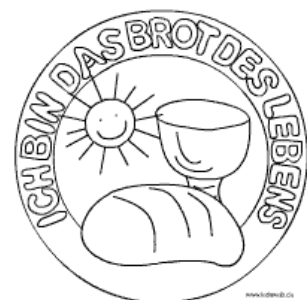
Abbildung 3:

Dieser Text aus der Bibel und die Feier dieses Tages ist gar nicht so einfach zu gestalten und darzustellen. Darum haben sich die Menschen früher überlegt, wie sie dieses Fest so gestalten können, dass man es versteht. Sie haben überlegt und kamen auf die Idee: wenn wir ein Haus, ... schön